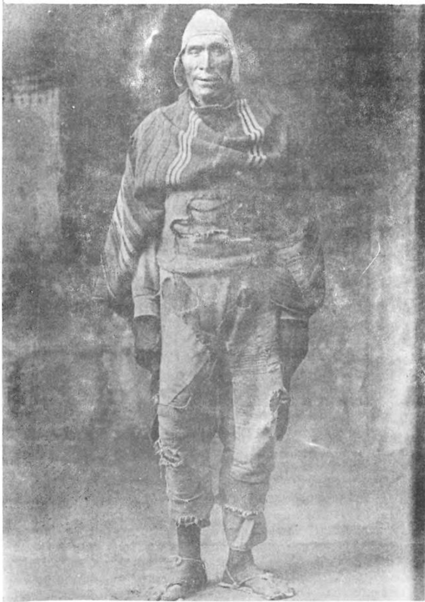
Campesino pobre de Quiquijana, provincia de Quispicanchis, departamento del Cusco.