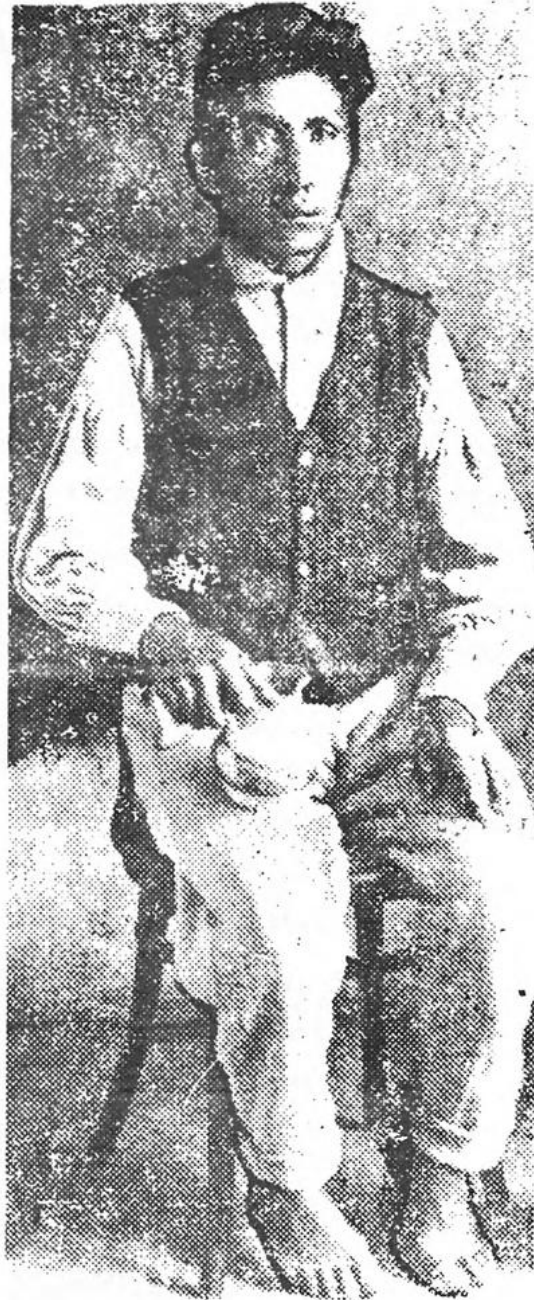
Quispe y Quispe, Eduardo

Candidato a la presidencia de la república en las elecciones de 1931.