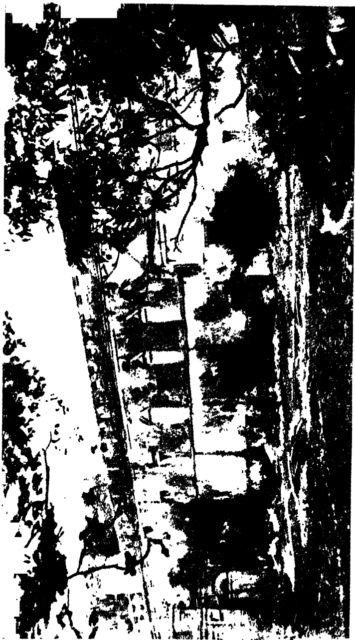
সংসদভবনে মুন্সী রাজন্যায়ণ দণ্ডের বসতবাড়ি